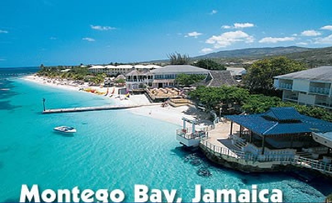
Montego Bay, Jamaica